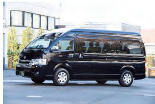
TOYOTA グランドキャビン